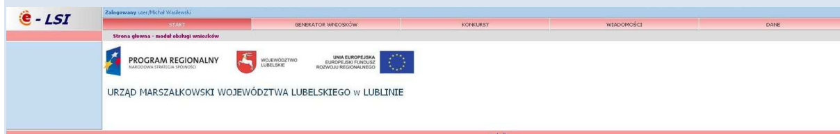
Rys. 4. Wygląd systemu e-LSI po zalogowaniu.

Po poprawnym zalogowaniu się do systemu na górze ekranu pojawia się pasek menu z zakładkami „START” „GENERATOR WNIOSKÓW”, „KONKURSY”, „WIADOMOŚCI”, „DANE”, „WYLOGUJ SIĘ” (Rys. 4).