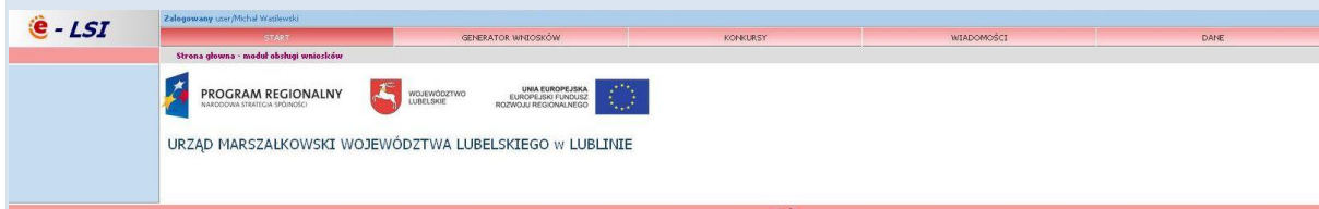
Rys. 4. Wygląd systemu e-LSI po zalogowaniu.

Po poprawnym zalogowaniu się do systemu na górze ekranu pojawia się pasek menu z zakładkami „START” „GENERATOR WNIOSKÓW”, „KONKURSY”, „WIADOMOŚCI”, „DANE”, „WYLOGUJ SIĘ” (Rys. 4).